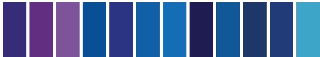
400 A S1 □ I Mauve Blue Shade Malva Bleu Matiz Azul 733 A S2 □ I Winsor Violet (Dioxazine) Violet Winsor (Dioxazine) Violeta Winsor (Dioxacina) 672 A S2 □ I Ultramarine Violet Violet Outremer Violeta Ultramar 263 A S2 □ I French Ultramarine Outremer Français Ultramar Francés 180 AA S5 □ Cobalt Blue Deep Bleu de Cobalt Foncé Azul de Cobalto Oscuro 667 A S1 □ I Ultramarine (Green Shade) Outremer (Nuance Verte) Ultramar (Matiz Verde) 178 AA S4 □ I Cobalt Blue Bleu de Cobalt Azul de Cobalto 321 A S4 □ I Indanthrene Blue Bleu d'indanthrene Azul de Indanthreno 706 A S2 □ I Winsor Blue (Red Shade) Bleu Winsor (Nuance Rouge) Azul Winsor (Matiz Rojo) 707 A S2 □ I Winsor Blue (Green Shade) Bleu Winsor (Nuance Verte) Azul Winsor (Matiz Verde) 538 A S1 □ I Prussian Blue Bleu de Prusse Azul de Prusia 137 AA S4 □ I Cerulean Blue Bleu de Céruléum Azul Cerúleo