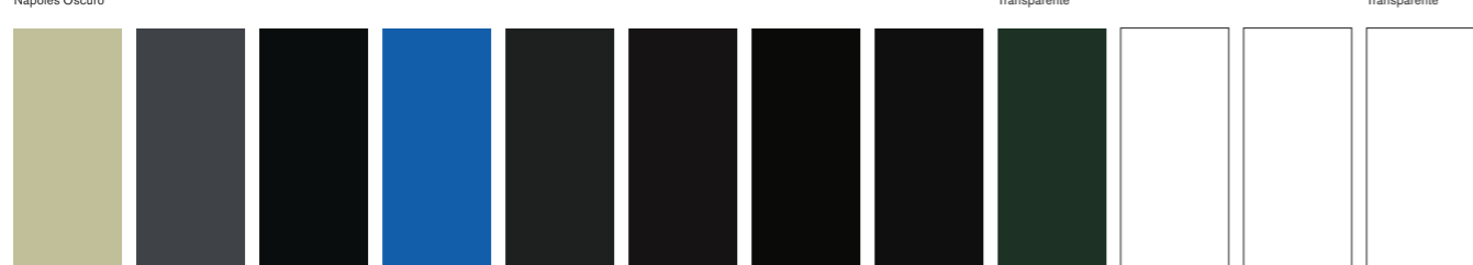
217 AA S2 □ I Davy's Gray Gris de Davy Gris de Davy 465 AA S1 □ I Payne's Gray Gris de Payne Gris de Payne 034 A S1 □ I Blue Black Noir de Vigne Negro de Vina 322 A S2 □ I Indigo Indigo Indigo 142 AA S1 □ I Charcoal Grey Gris de Fussain Gris de Carbón 386 AA S2 ■ Mars Black Noir de Mars Negro de Marte 331 AA S1 □ I Ivory Black Noir d'ivoire Negro de Marfil 337 AA S1 ■ Lamp Black Noir de Fumée Negro de Humo 505 A S1 □ Perylene Black Noir de Perylene Negro Perileno 242 AA S1 ■ Flake White Hue Nuance de Blanc De Plomb Tono de Blanco De Plomo 748 AA S1 ■ Zinc White Blanc de Zinc Blanco de Zinc 674 AA S1 ■ I Underpainting White (Fast Drying) Blanc de Sous-Couche (Séchage Rapide) Blanco Subcapa (Secado Rápido)

ASTM I Excellent lightfastness / excellente résistance à la lumière. Permanent for artists' use / Permanent pour usage artistique II Very good lightfastness / très bonne résistance à la lumière. Permanent for artists' use / Permanent pour usage artistique