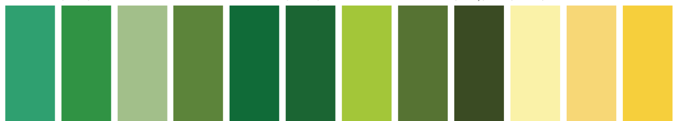
708 A S2 ■ I Winsor Emerald Émeraude Winsor Esmeralda Winsor 483 A S2 □ I Permanent Green Light Vert Permanent Clair Verde Permanente Claro 637 AA S1 □ I Terre Verte Terre Verte Tierra Verde 459 AA S4 ■ I Oxide of Chromium Oxyde de Chrome Oxido de Cromo 540 A S2 □ I Prussian Green Vert de Prusse Verde de Prusia 599 A S2 □ I Sap Green Vert de Vessie Verde Vejiga 084 A S4 ■ I Cadmium Green Pale Vert de Cadmium Pâle Verde de Cadmio Pálido 294 A S2 □ I Green Gold Or Vert Verde Oro 447 A S2 □ I Olive Green Vert Olive Verde Oliva 426 A S1 ■ I Naples Yellow Light Jaune de Naples Clair Amarillo de Napoles Claro 422 AA S1 ■ Naples Yellow Jaune de Naples Amarillo de Napoles 333 A S1 ■ I Jaune Brillant Jaune Brillant Amarillo Brillante