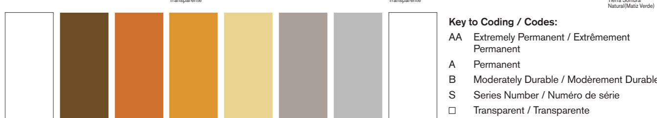
644 AA S1 ■ I Titanium White Blanc de Titane Blanco de Titano 058 A S2 □ Bronze Bronze Bronce 214 A S2 □ Copper Cuivre Cobre 573 A S2 □ Renaissance Gold Or Renaissance Oro Renacimiento 283 A S2 □ Gold Or Oro 511 A S2 □ Pewter Etain Peltre 617 A S2 □ Silver Argent Plata 330 A S1 □ Indescent White Blanco Nacré Blanco Iridescente

Key to Coding / Codes: AA Extremely Permanent / Extrêmement Permanent A Permanent B Moderately Durable / Modèremment Durable S Series Number / Numéro de série □ Transparent / Transparente □ Semi-Transparent / Semi-transparente ■ Semi-Opaque ■ Opaque Sizes Available / Formats Disponibles: 116 colours - 37 ml 32 colours - 200 ml